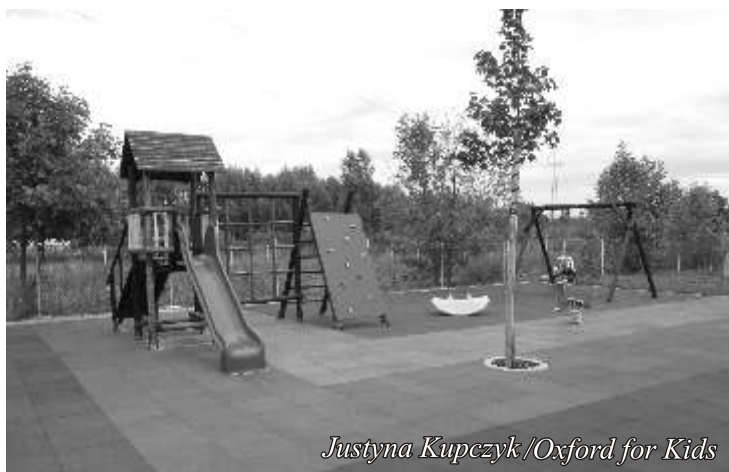
Justyna Kupczyk/Oxford for Kids

Podstawową formą działalności dziecka w wieku przedszkolnym jest zabawa. Zabawa nie jest tylko rozrywką, ta forma aktywności jest wyznacznikiem rozwoju psychicznego, podlega kształtowaniu i doskonaleniu wraz z wiekiem. W trosce o rozwój i bezpieczeństwo naszych podopiecznych dokonaliśmy renowacji przedszkolnego placu zabaw. Znaczna część terenu została pokryta bezpiecznym, syntetycznym podłożem, który chroni dzieci przed urazami i podwyższa komfort zabawy. Na placu dzieci mają do dyspozycji zadaszoną piaskownicę, huśtawki, domek, zjeżdżalnię, ściankę wspinaczkową oraz zabawki kształtujące motyrykę dużą u dzieci. Wszystkie zabawki i sprzęty posiadają odpowiednie certyfikaty. Plac zabaw jest ogrodzony i zamykany, dzięki czemu zapewniamy naszym dzieciom poczucie bezpieczeństwa.