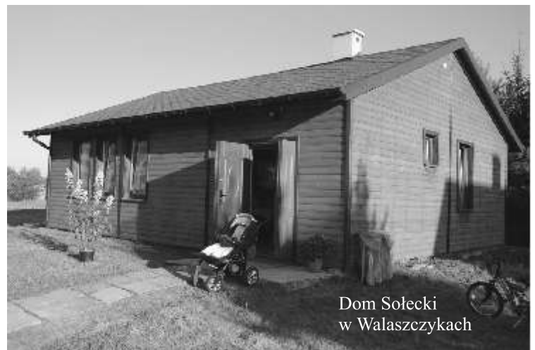
Dom Sołecki w Walaszczkach