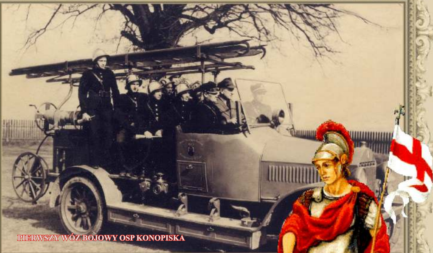
PIERWSZY WÓZ BOJOWY OSP KONOPISKA

Aleksandria I, Aleksandria II, Hutki, Jamki-Kowale, Konopiska, Kopalnia, Korzonek-Le niaki, Łaziec, R kszowice, Walaszczyki, W sosz, Wygoda-Kijas