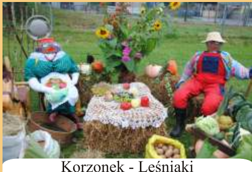
Korzonek - Leśniaki