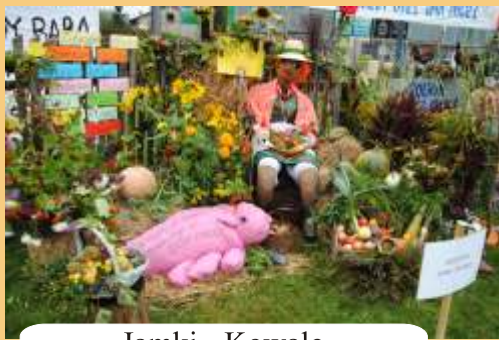
Jamki - Kowale