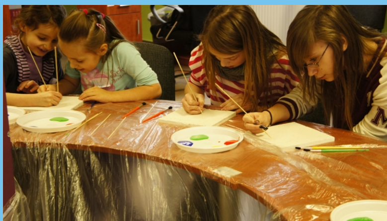
Warsztaty plastyczne w ramach ferii z GCKiR-em