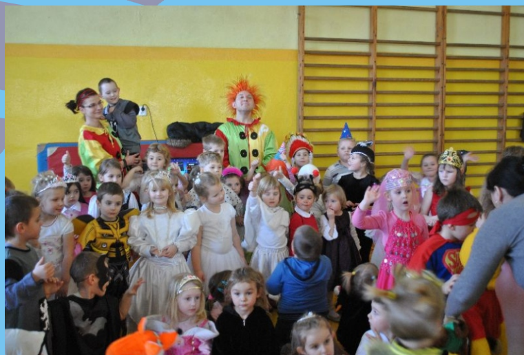
Wielki bal dla przedszkolaków