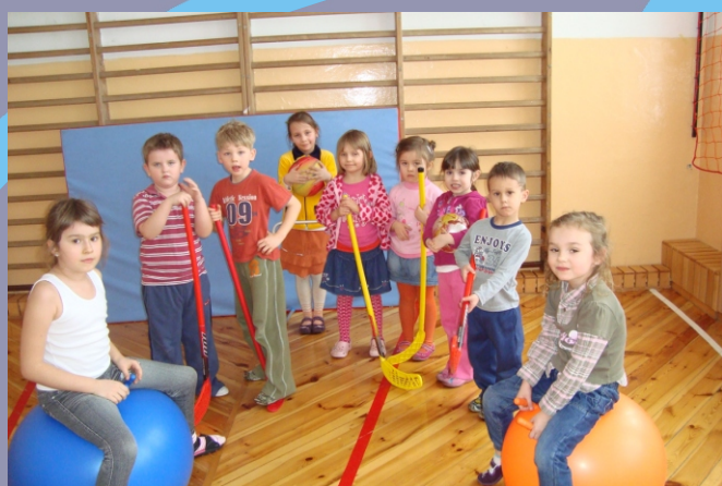
Zajęcia w ramach projektu "Być przedszkolakiem"