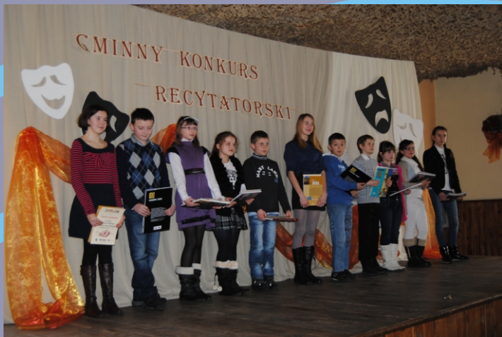
Gminny Konkurs Recytatorski w Korzonku