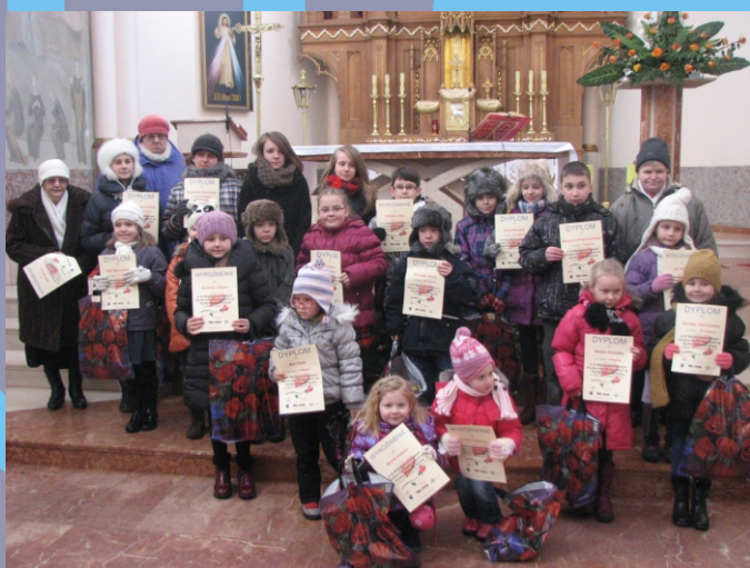
Rostrzygnięcie konkursu na kartkę walentynkową